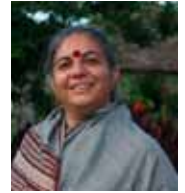
DR. VANDANA SHIVA

Die Inderin studierte Quantenphysik und engagiert sich seit 1988 aktiv gegen die Agrargentechnik. Bereits zu dieser Zeit wurde in Indien den Bauern genverändertes Saatgut als DIE Lösung für die Zukunft eingeredet.